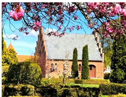
Den Gamle Kirkegårds kapel

Bærerne skulle møde op i sort høj hat og sorte frakker. I begyndelsen i deres egen påklædning. I perioden første november til første maj skulle frakkerne være knappet helt op til halsen, mens øverste knap skulle være åben resten af året.